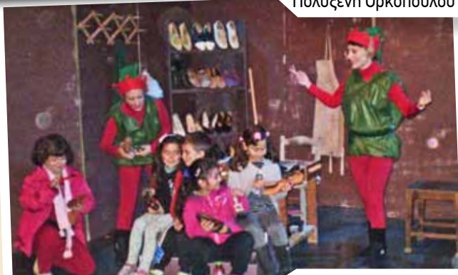
Μπήκαμε και εμείς στο εργαστήριο του τσαγκάρη.