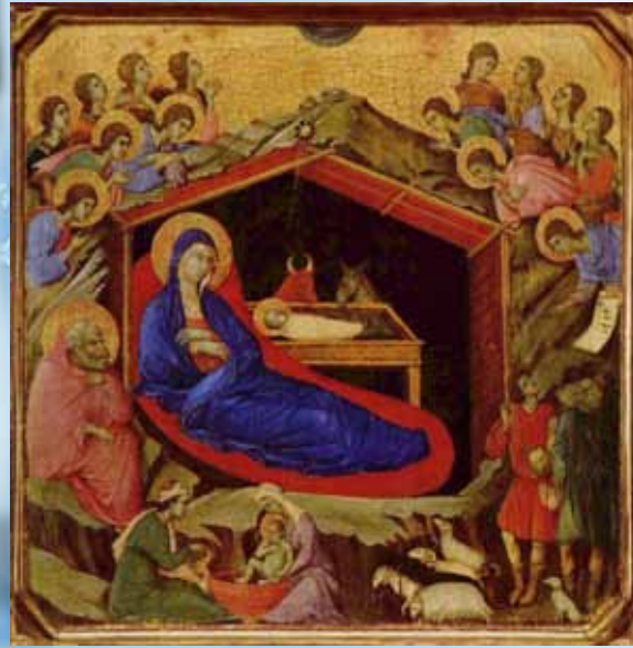
Από τους μαθητές της Α' τάξης με αφορμή το βιβλίο της Αγγελικής Βαρελά «Με ευχές, φλουριά και αγάπη»