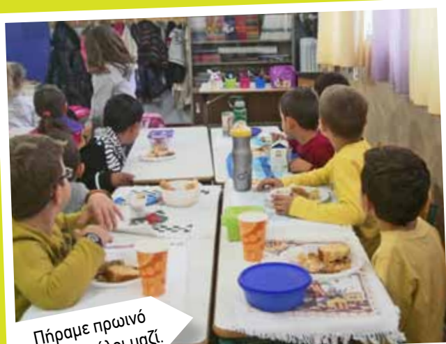
Πήραμε πρωινό στην τάξη όλοι μαζί.