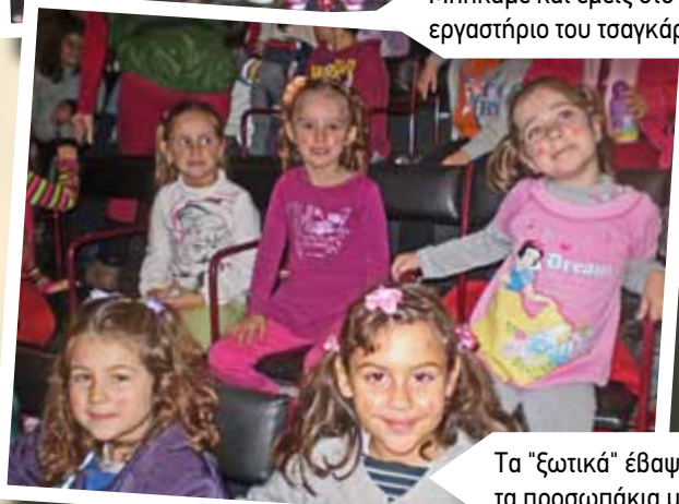
Τα "ξωτικά" έβαψαν τα προσωπάκια μας!