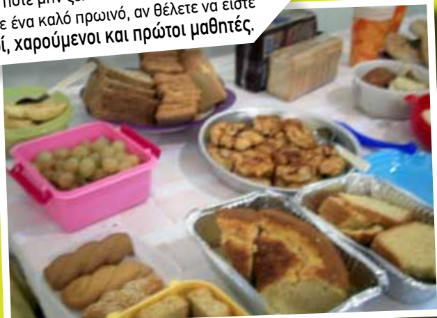
Παιδιά ποτέ μην ξεκινάτε τη μέρα σας χωρίς να φάτε ένα καλό πρωινό, αν θέλετε να είστε λεπτοί, χαρούμενοι και πρώτοι μαθητές.