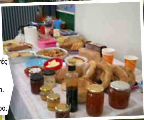
Φέραμε υγιεινές τροφές και φάγαμε με μεγάλη όρεξη. Ήταν μια ξεχωριστή μέρα.