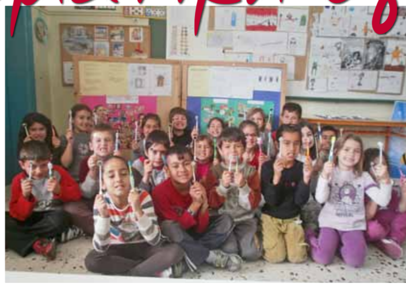
Μαθαίμε να φροντίζουμε σωστά τα δόντια μας