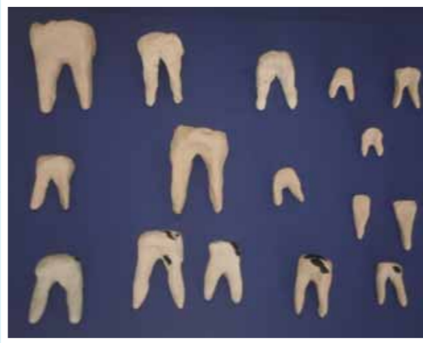
Γερά και άρρωστα δόντια από πλαστελίνη