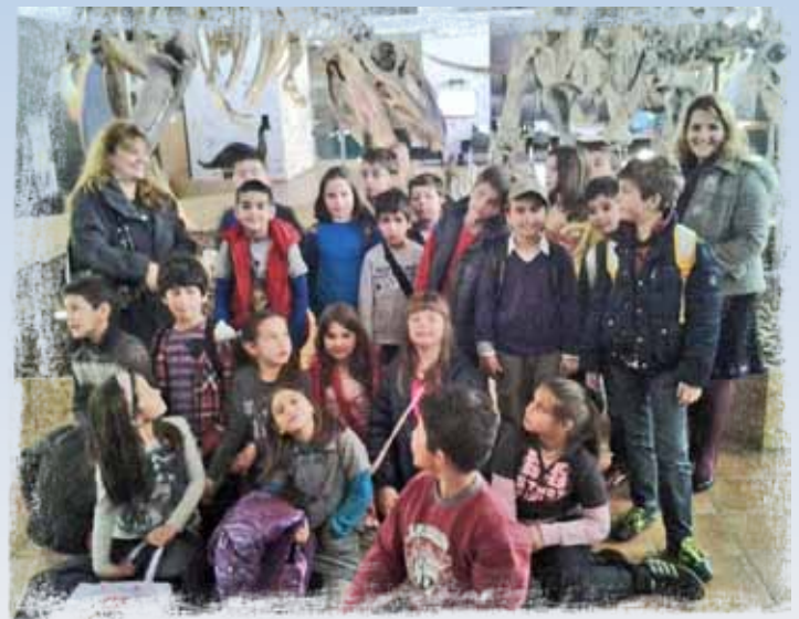
Τώρα καμαρώστε μας δίπλα στους τεράστιους "φίλους" μας!