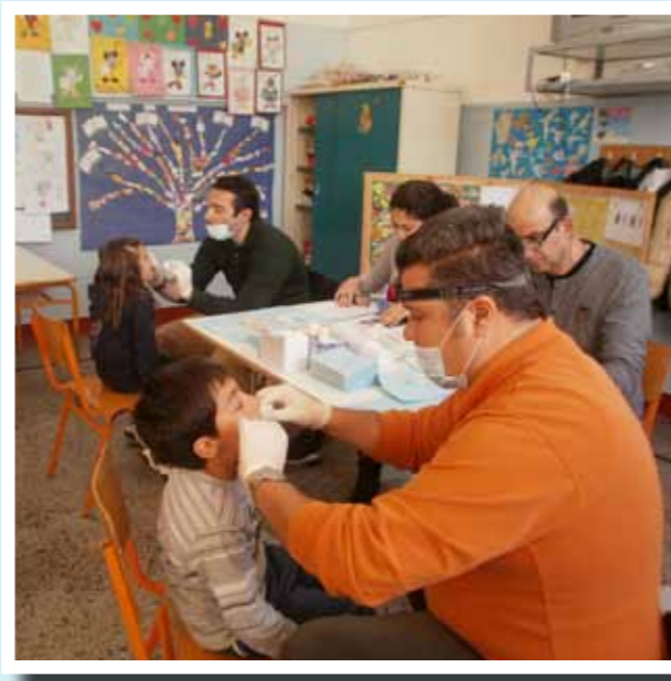
Οδοντιατρική εξέταση και φθορίωση

Ευχαριστούμε τους οδοντίατρους που βοήθησαν στην υλοποίηση του προγράμματος και παρείχαν οδοντιατρική εξέταση και φθορίωση στους μαθητές.