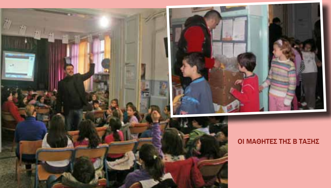
ΟΙ ΜΑΘΗΤΕΣ ΤΗΣ Β ΤΑΞΗΣ

Στο τέλος μοίρασαν σε όλους μας από μία νόστιμη μπανάνα!