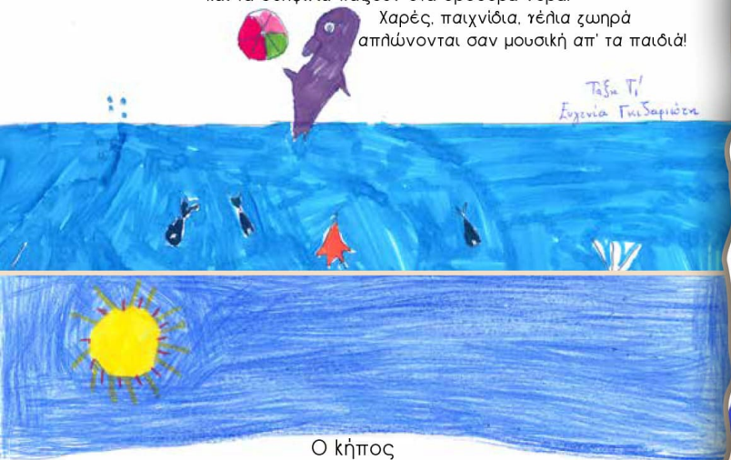
Τάξη Γ' Ευγενία Γκισαριώτα

Η Θάλασσα είναι όμορφη καθώς απλώνεται πέρα από τον ορίζοντα... Το κύμα χαϊδεύει την αμμουδιά και τα δελφίνια παίζουν στα όρσοερά νερά. Χαρές, παιχνίδια, γέλια ζωηρά απλώνονται σαν μουσική απ' τα παιδιά!