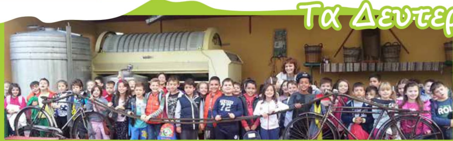
Η Β τάξη στο παπύρι Λινόσ στο Σολομό, μαθαίνουν για τη διαδικασία παραγωγής του κρασιού