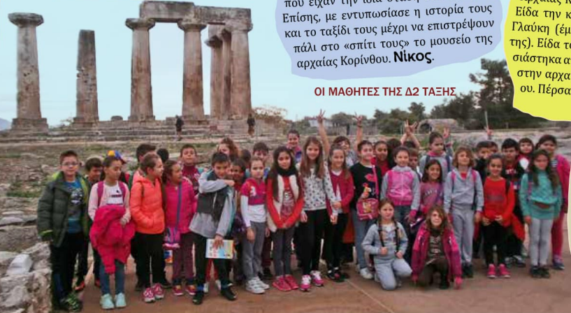
ΟΙ ΜΑΘΗΤΕΣ ΤΗΣ Δ2 ΤΑΞΗΣ