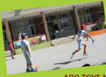
ΑΠΟ ΤΟΥΣ ΜΑΘΗΤΕΣ ΤΗΣ Β3' ΤΑΞΗΣ

Είμαστε φίλοι ό,τι κι αν γίνει! Αυτό να θυμάσαι ποτέ μην το ξεχνάς!