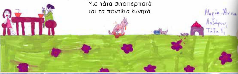
Μαρίε Άννα Παζάρου, Τάξη Γ'

Ο κήπος είναι όμορφος με τα μυρωδάτα πουλούδια και τις μελίσσες. Τις πολύχρωμες πεταλούδες που πετούν. Μια γάτα σιγοπερπατά και τα ποντίκια κυνηγά.