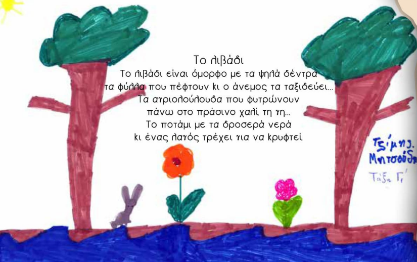
Τσίμη, Μητσούδα Τάξη Γ'

Το ήλιβάδι είναι όμορφο με τα ψηλά δέντρα τα φύλλα που πέφτουν κι ο άνεμος τα ταξιδεύει... Τα αγριοπούλουδα που φυτρώνουν πάνω στο πράσινο χαλί τη γη... Το ποτάμι με τα όρσοερά νερά κι ένας πάτος τρέχει για να κρυφτεί