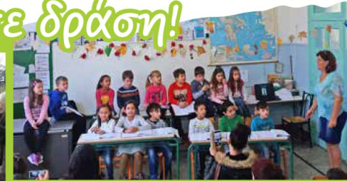
Οι μαθητές του Β2 τίμησαν το Πολυτεχνείο με ζωγραφιές, κατσκευές, σκετς και τραγούδια μπροστά στους γονείς της τάξης.